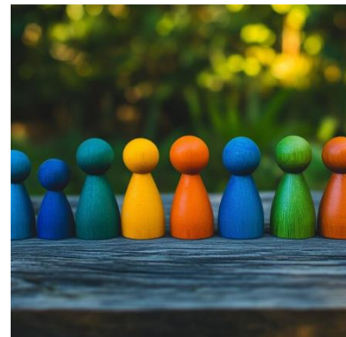
Abbildung 1: Drei Grundpfeiler unserer Schule (Grossen 2024, Folie 25).