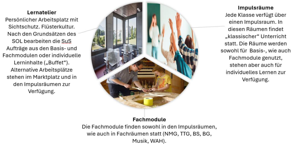
Abbildung 2: Drittelsprinzip der Unterrichtsräumlichkeiten

Da der Unterricht unter anderem in den Lernateliers der Lernlandschaften stattfindet, kann das ungefähre Drittelsprinzip bei der Raumnutzung angewandt werden (vgl. Abb. 4).